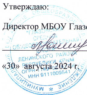
График приема пищи обучающихся в школьной столовой на I полугодие 2024-2025 учебного года